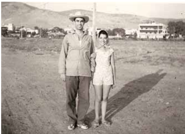
Η Βούλα ως αγροτική περιοχή με το θουνό στο βάθος καθαρό...

Εκθεση φωτογραφίας με θέμα “Παλιά Βούλα”, οργάνωσε ο Εξωραϊστικός Σύλλογος “Ευρυάλη Βούλας” και παράλληλα έκοψε την παραδοσιακή βασιλόπιτα την περασμένη Κυριακή 18/1