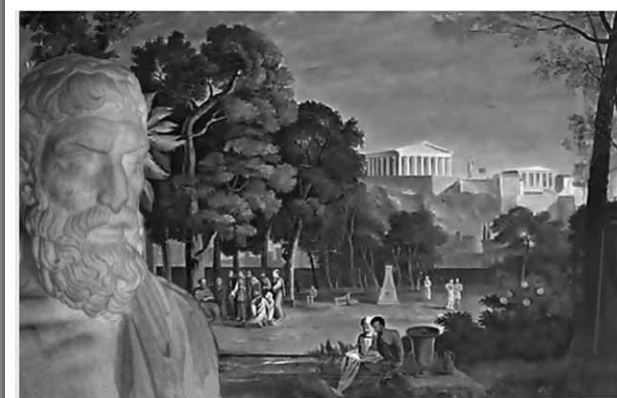
Ο Επίκουρος (μουσαίο Καπιτωλίου) και "ο κήπος του φιλοσόφου" (Antal Strohmayer, Αθήνα 1834)

Για πέμπτη συνεχή χρονιά ο Δήμος Παλλήνης και οι Φίλοι Επικούρειας Φιλοσοφίας "ΚΗΠΟΣ ΑΘΗΝΩΝ" και "ΚΗΠΟΣ ΘΕΣΣΑΛΟΝΙΚΗΣ" καλούν το κοινό να προσέλθει με ελεύθερη είσοδο στο Πανελλήνιο Συμ- πόσιο Επικούρειας Φιλοσοφίας, το μοναδικό φιλο- σοφικό συνέδριο στην Ελλάδα που έχει καθιερωθεί ως ετήσιος θεσμός από τον κόσμο και όχι από την κορυφή.