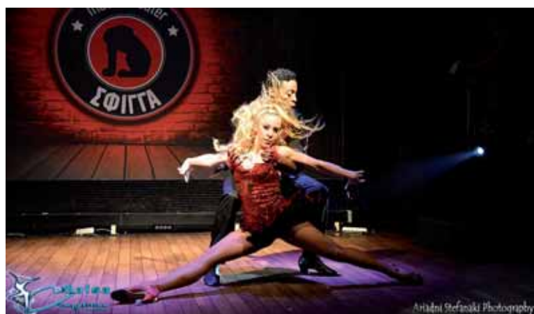
Στιγμιότυπο από το show των 3ων παγκόσμιων πρωταθλητών Gaby & Estefy

αναδείξει τα νέα talέντα της Ελλάδας στην Salsa και να τους ανοίξει μια πόρτα στο επόμενο βήμα τους εξασφαλίζοντας γι' αυτά τις πρώτες τους εμφανίσεις σε χορευτικά φεστιβάλ του εξωτερικού και της Ελλάδας.