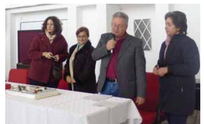
Στιγμιότυπα από την κοπή της βασιλόπιτας. Παραβρέθηκαν πολλοί εκπρόσωποι της Δημοτικής Αρχής που έκαναν και χαιρετισμούς καθώς και υποψήφιοι βουλευτές.