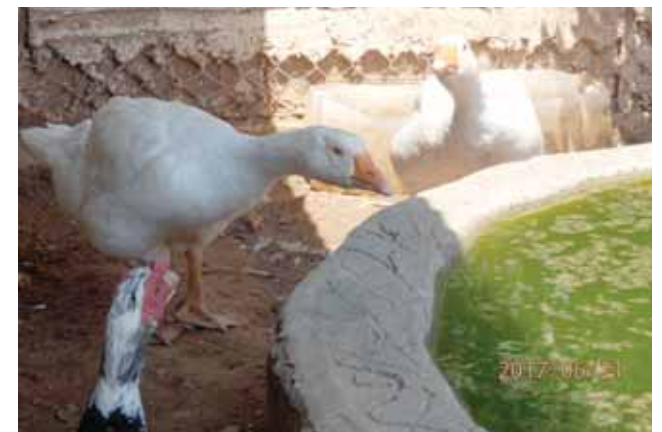
Η λίμνη με τις χήνες και τις πάπιες. Πιο κάτω το κοτέτσι με τις κόττες.

Τις γνώσεις στα περιβαλλοντικά προγράμματα από τον πατέρα μου, και τις προσπάθειές του να αποκτήσουν οι μικροί μαθητές οικολογική συνείδηση, μέσα από βιωματικά παραδείγματα και τις παιδαγωγικές μεθόδους που χρησιμοποιούσε. Οι παρακαταθήκες τους είναι πολύτιμες. Έχω όμως και φρεσκαρισμένη γνώση από την Σχολή Νηπιαγωγών που αποφοίτησα και βέβαια την αγάπη για το περιβάλλον, που μου εμφύσησαν οι γονείς μου.