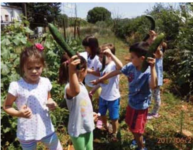
Ψάχνοντας τις αγγουριές "ανακάλυψαν" πολλά αγγούρια, που θα γίνουν μία δροσιστική σαλάτα

Πολλοί άνθρωποι που μας έβλεπαν μας έδιναν συγχαρητήρια, κι αυτό μου άρεσε και δεν ντρεπόμουν καθόλου γιατί έκανα κάτι πολύ χρήσιμο για τη φύση.