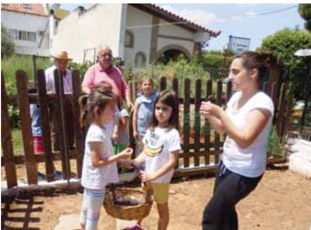
Φρεσκότατα αυγά από τις κοτούλες, που τρέφονται από τα προϊόντα του κήπου που τρώμε εμείς, αλλά αφήνουμε κάποια...