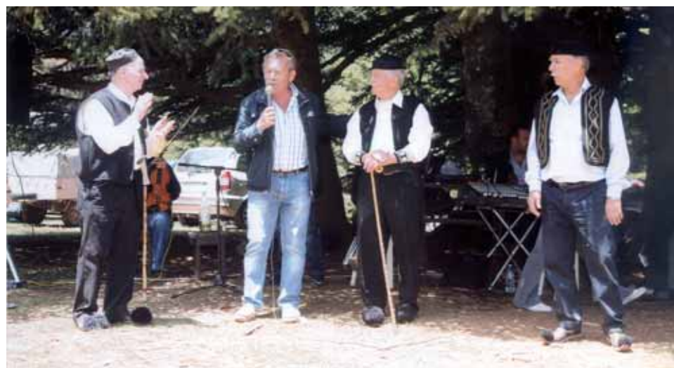
Ο Αντιπεριφερειάρχης Ανατ. Αττικής Πέτρος Φιλίππου χαιρετίζει την εκδήλωση.

τηρώντας έτσι και ζωντανή τη μνήμη στις παραδόσεις των προγόνων τους! Οι Σαρακατσάνοι απηύθυναν ευχαριστίες σε όλους τους χορηγούς που βοήθησαν