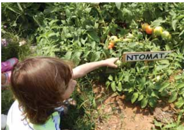
Ο Ιωάννης μαζεύει τις ντομάτες που ο ίδιος φύτεψε και φρόντισε.

Και παραδίπλα τα αρωματικά : βασιλικοί, φασκόμηλο, δυόσμος, ρίγανη, δάφνη, θυμάρι .... και το φυτώριο με τα μικρά φυτά και τους σπόρους που αργότερα μεταφυτεύονται σε μεγάλες γλάστρες για να δοθούν στα παιδιά.