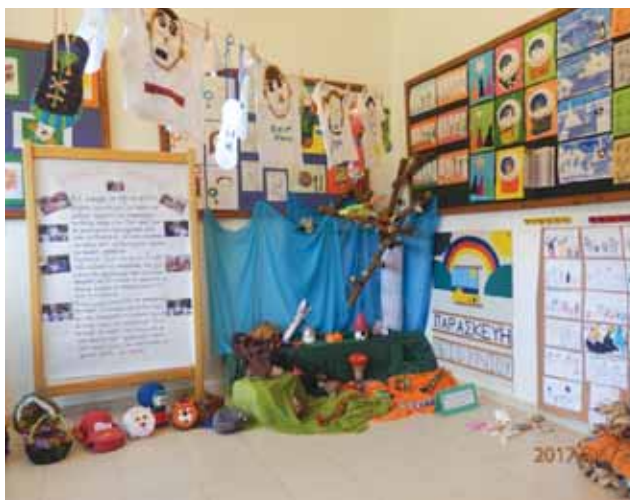
Μια γωνιά του Εκθεσιακού χώρου, με έργα των παιδιών όλης της χρονιάς.

Κ.Β. Ηρώ, είσαι άξια συνεχιστής των γονιών σου και σε θαυμάζω. Θα είναι περήφανοι αν αναδειχθείς καλύτερη απ' αυτούς, κάτι που το πιστεύω.